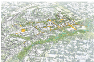
Le Jarret Frais-Vallon-La-Rose, Marseille (13)