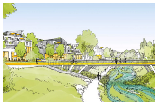
Branche de Croix Wasquehal (59)