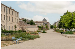
Le Mail de Saint-Maixent Saint-Maixent-L'École (79)

urban|act| redynamise les centres-villes en déprise