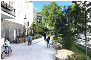
Le centre-ville de Bondy Seine-Saint-Denis (93)