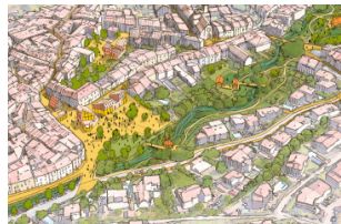
Le centre-ville de Montbazin Hérault (34)

Agence Urban Act 33 rue de Montreuil 75011 Paris France urbanact@urban-act.com 01 44 93 20 99 urban-act.com