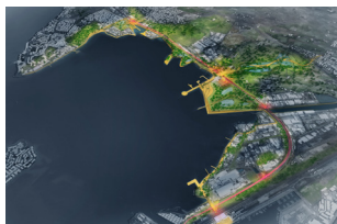
L'Arc de Thau Agglomération de Sète, Hérault (34)

urban|act| expérimente la sobriété foncière