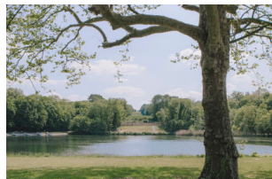
Le parc du Hangar Y Meudon (92)

urban|act| expérimente la sobriété foncière